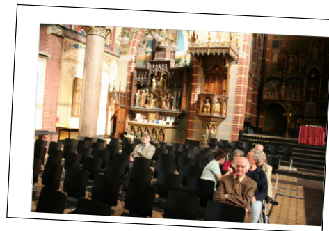
..., op het orgel van de Dominicus