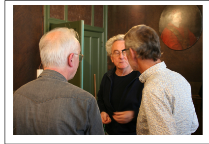
Nogmaals een kleine pauze